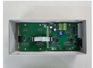
ภาพบอร์ดภายในของรุ่น AB-504 (2.3 นิ้ว 4 หลัก)