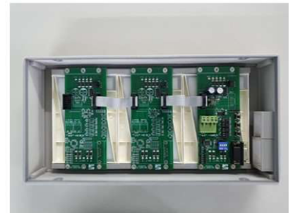
ภาพบอร์ดภายในของรุ่น AB-603 (4 นิ้ว 3 หลัก)