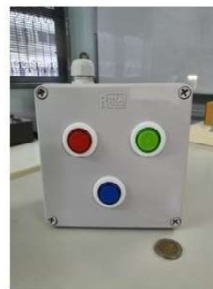
กล่องปุ่มกดขนาดใหญ่ เลือกใส่เป็น 1-3 ตัวได้ (Option)