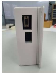
ขั้ว DB9S และช่องกดปุ่มของรุ่นตัวเลข 4 นิ้ว