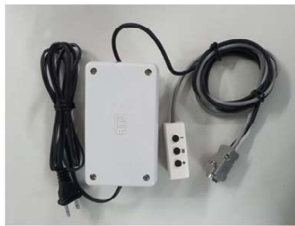
ภาคจ่ายไฟ Adap2 พร้อมสายปุ่มกด SWX3 (Option)