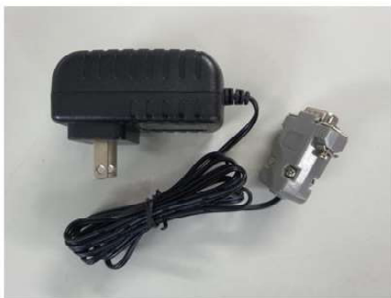
ภาคจ่ายไฟ Adap3 (Option)