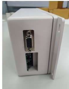
ขั้ว DB9S และช่องกดปุ่มของรุ่นตัวเลข 2.3 นิ้ว