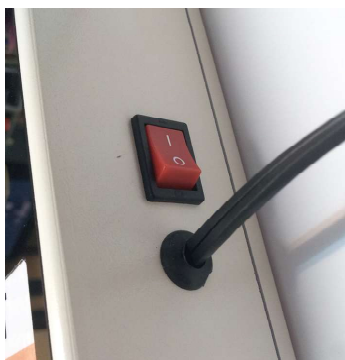
สายปลั๊กและสวิตช์