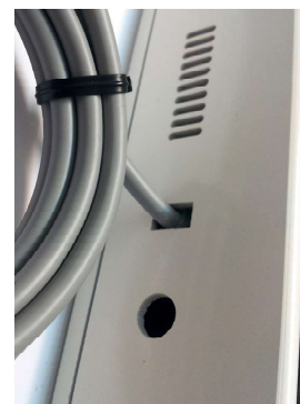
สาย Sensor และรูสอดสายสำหรับ Relay