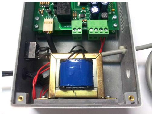
ภาพหม้อแปลงภายใน